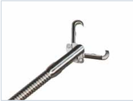
Einweg Fremdkörperzange „Rattenzahn“ Disposable grasping forceps „Rat Tooth“ type